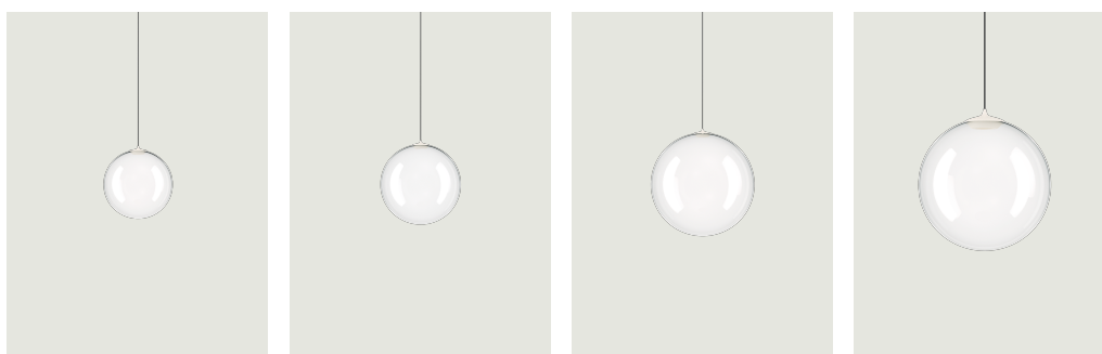
Random Solo 12